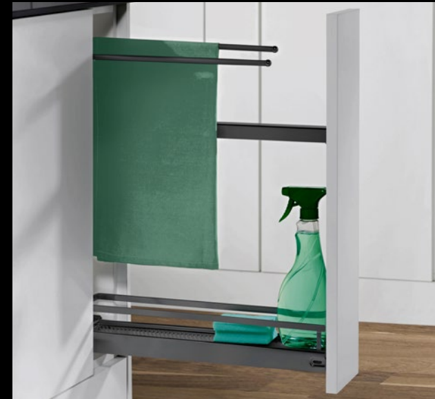
UAZH 15 Unterschrank 15 Auszug, Handtuchhalter