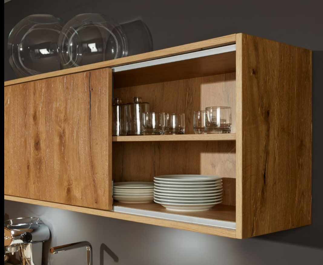
Regal in Stollenbauweise Shelf in gallery design Étagère de type tunnel Regalen gevormd met stollen.