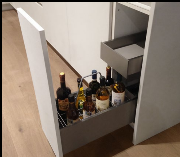
UFT 30 Unterschrank 30 Flaschenauszug