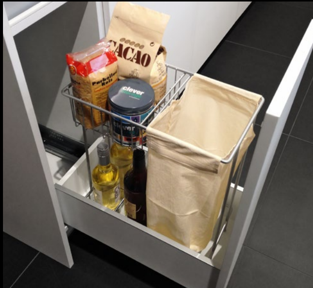
UBT 30 Unterschrank 30 Brotbeutelhalter