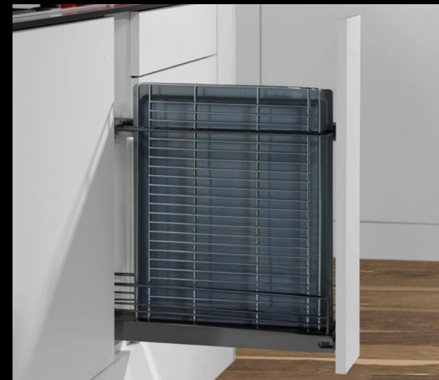
UAZB 15 Unterschrank 15 Auszug, Backblechhalter

base unit 15 baking tray and tray holder