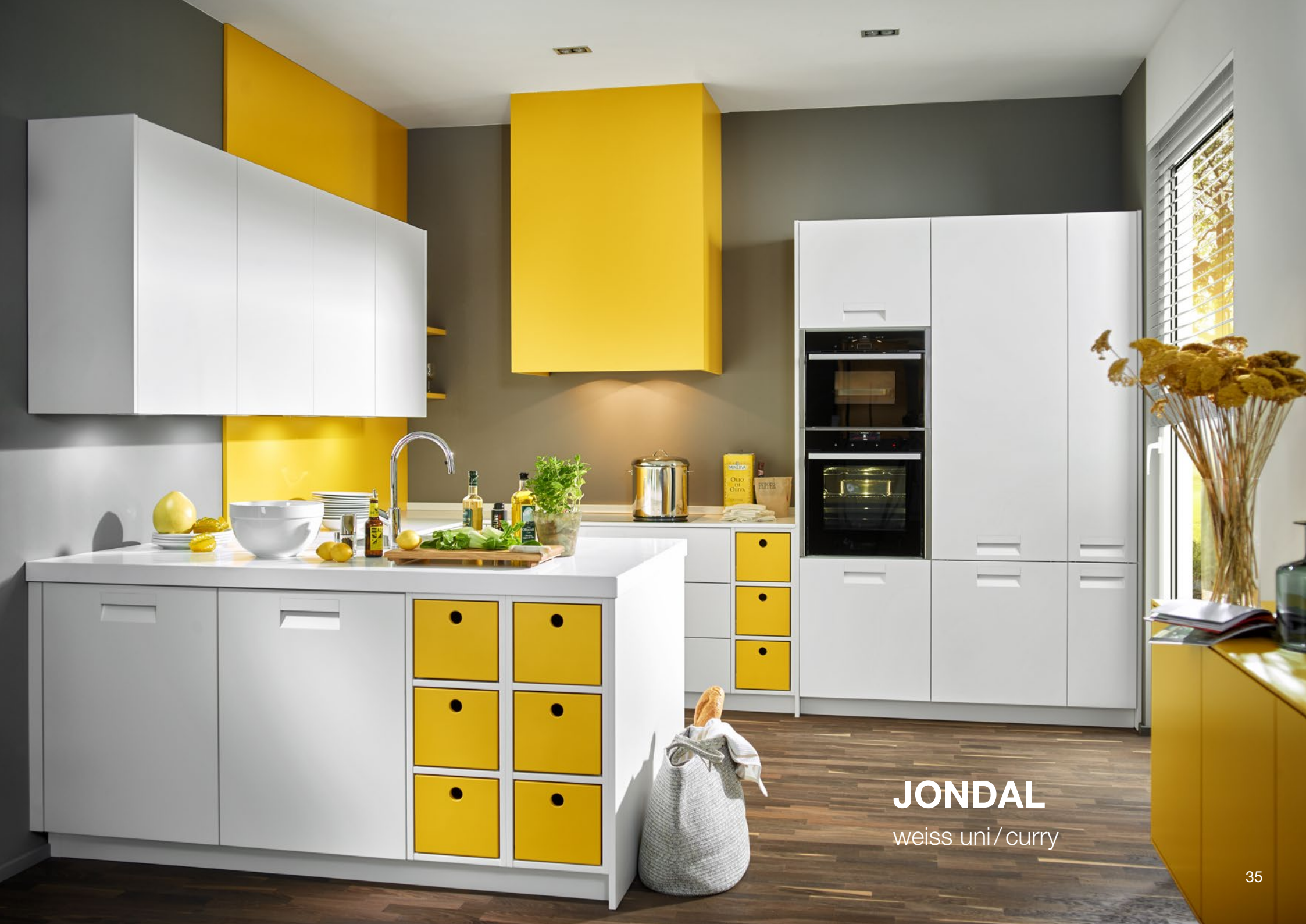
JONDAL weiss uni/curry